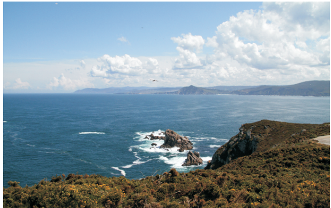
Ilotes Os Cabalos e vista cara ao norte