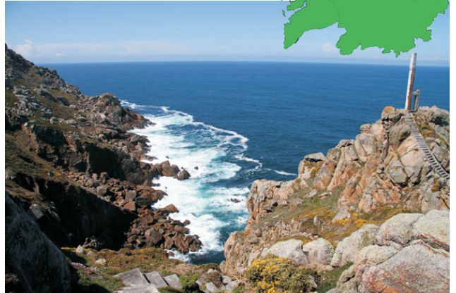
Punta de Cabo Prior