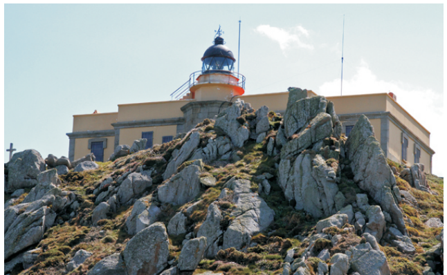
Faro de Cabo Prior

Unha ruta circular para gozar do contraste dos cantís coa paisaxe, de grandes praias con sistemas dunares ben conservados, dos arredores. Podemos achegarnos a numerosos puntos con vistas panorámicas.