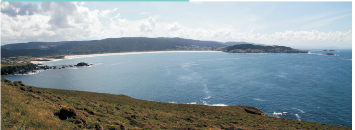
Panorámica cara ao sur coa praia de San Xurxo e as illas Herbosa e Gabeiras

Accédese desde Ferrol pola estrada de Covas. Déixase o coche en Prior, no cruce onde se sinala o camiño do Faro. Recoménase comezar pola estrada que vai ata o faro e volver polo camiño de terra que se une coa estrada que vai ao portiño da Cova do Varadeiro.